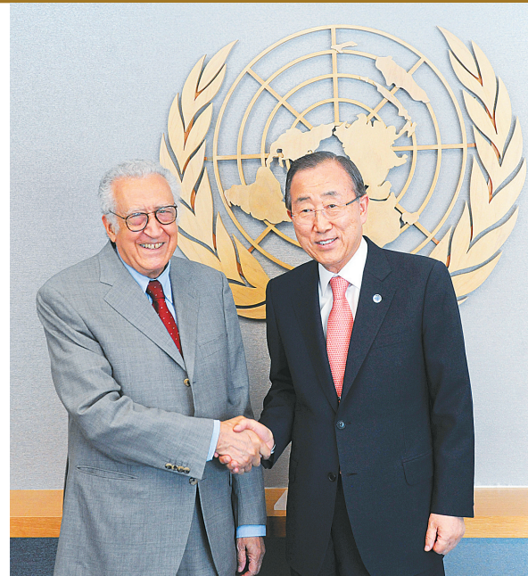
8月24日,联合国秘书长潘基文(右)在纽约联合国总部会见新任命的联合国-阿拉伯联盟(阿盟)叙利亚危机联合特别代表拉赫达尔·卜拉希米。

萨利希表示,伊朗希望在不结盟运动峰会结束后为叙利亚政府和反对派举行对话会议,以解决叙利亚危机。他说,叙利亚政府和“大多数反对派成员”均已表示愿意参加此类对话会议。