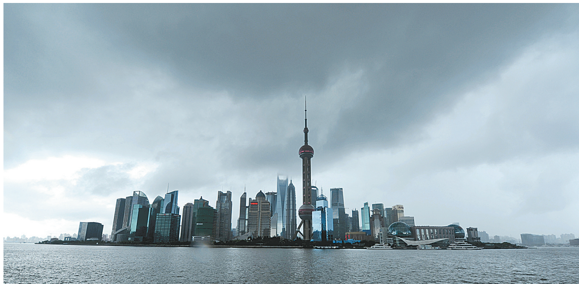
8月25日,受台风“布拉万”外围影响,上海市上空乌云密布。

据新华社上海8月25日电 上海中心气象台25日发布最新强台风消息,强台风“布拉万”预计将于27日在距上海以东约200公里至300公里的海面上,越过上海同纬度北上,期间将给上海带来风雨影响。