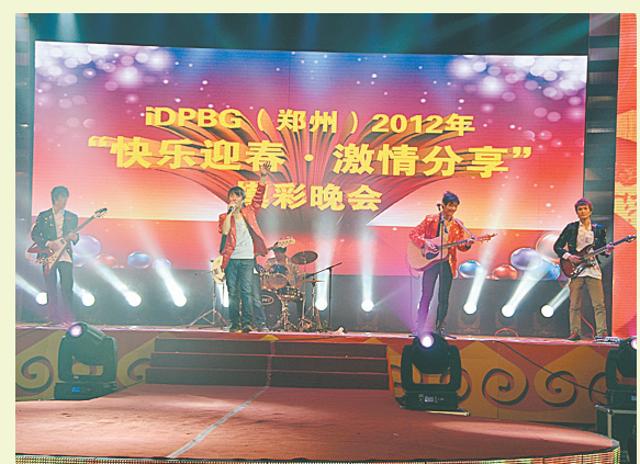
“单车乐队”在迎春晚会上激情演出。

现在, 单车乐队多次出演郑州园区举办的活动, 在园区已经小有名气, 演出时有粉丝来献花, 在路上也经常被人追着索要签名。不过, 这些年轻人并没忘记自己的本分, 他们坚持做好自己的本职工作, 并利用一切业余时间练习。有梦想才会有未来, 未来的日子里, 他们将继续用音乐将热情和快乐传递给园区的每位同事。