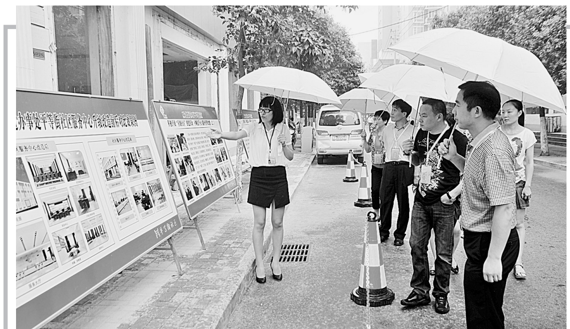
昨日,管城区西大街办事处邀请辖区人大代表,就街道经济发展、网格化管理、星级社区建设和基层党建进行视察。代表们对街道工作提出了许多可行性建议。 本报记者 梁月琳 摄

段。从8月31日至9月5日,由各建设、施工和监理单位负责对所建工程组织全面自查自评。各县(市)区建设(市政)主管部门及市政工程质量监督站,安监站根据各承建单位报送情况进行全面普查。抽查和复查阶段,时间从9月5日至9月15日。由检查组对各县(市)区在建和已竣工工程进行抽查,其中,对申报“河南省市政优良工程”、“河南省市政工程金奖”及“河南省市政工程省级文明工地”的项目将进行全