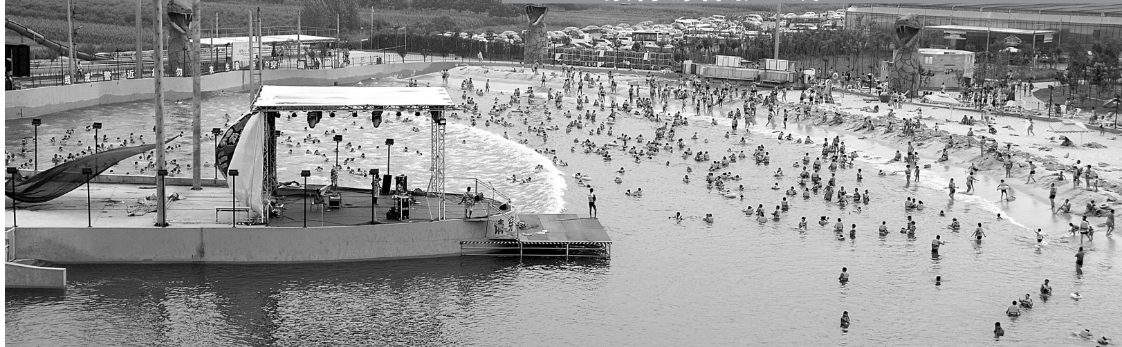
荥阳旅游景点之一 奥帕拉拉中心浴场游人如织。

本报讯(记者 史治国 通讯员 樊延朝 文/图)记者从荥阳市旅游和文物局获悉,入夏以来,荥阳依托省会近郊的优越位置、清静秀美的山水风光、生机勃勃的旅游新业态,围绕避暑度假、中老年休闲养生、企事业单位团体活动、广大市民自助出游等旅游消费群体,大力改善配套设施,力推沿黄古韵游、寻古追思游、清