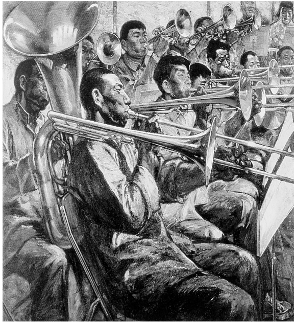
在希望的田野上(水彩画) 戴恒扬

网上有个段子说,某时髦靓女上网搜索理想男友:要帅,有车。结果是:象棋。女不甘心,再搜:有房,有钱。结果是:银行。女还不甘心,再搜:有爱心,体贴人。结果是:奥特曼。女十分生气,于是将上述全部条件输入,良久,计算机十分艰难而又缓慢地打出一行字:“奥特曼在银行下象棋。”那些一味追求“高富帅”与“白富美”的人,最后会不会也收获一位在银行下象棋的奥特曼呢?让我们拭目以待。