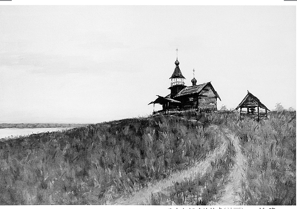
伏尔加河畔的钟声(油画) 刘晓

站在伏山之巅,南望嵩山诸峰,北瞰河洛汇流,西边的巩义市区,东面的上街、荥阳都尽收眼底。往东南方看,巩义、荥阳交界处,有一座五云山(俗称塔山,海拔589.4米)和伏山遥遥相对。两山连线的中点有一座小山,叫铁山。铁山北麓的支锅石沟,有三块鼎立的红色巨石,石缝中原有一棵两搂多粗的“丫”字形柏树,西边不远处有一座建于清乾隆年间的二郎庙。相传远古时天上有十个太阳,晒得大地干裂,草木枯焦,庄稼绝收,民生凋敝。龙王、土地联合上奏玉帝,玉帝命二郎神捉拿九日压于山底,仅留一日照明。二郎神受命担山赶太阳,历尽千辛万苦,大功基本告成,九个太阳被压山下,不再为患。此时的二郎神,仍肩挑两座大山,手提一座小山,精疲力竭,饥渴难耐,只得扔下扁担,放下三山,坐下休息。他用三块石头支起一口大锅,取嵩山之柴,舀黄河之水,生火做饭,吃了三锅方饱。从此这里留下了支锅石的遗迹,烧火杈长成了大柏树,倒到北岭的剩饭变成了现在的大棚砸堆,肩挑的山就是现在的伏山、塔山,手提的山形成了现在的铁山。为纪念二郎神的功德和精神,人们建起了二郎庙,每年农历十一月十五举行二郎庙会,十分热闹。2009年,支锅石被列为巩义市文物保护单位。