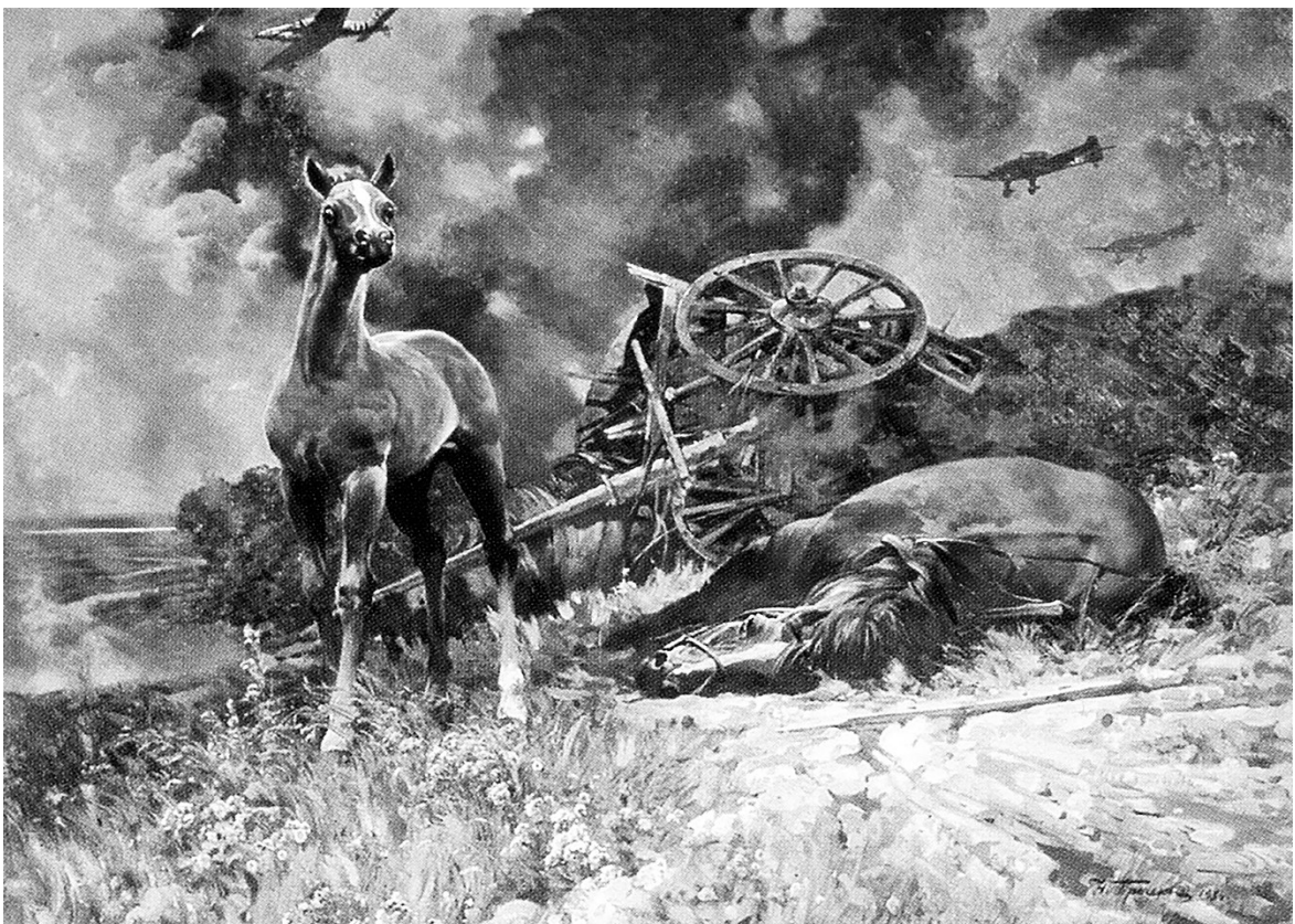
荒乱年代(油画) 别斯金(俄罗斯)

这部小说的组成材料极其丰富：新闻、书信、日记、书籍旁批、诗歌、短信、历史故事、图案……这种拼贴手法虽然并不新鲜，但如何有条不紊组织在一起则需要一定的结构能力。我以为墨白是下了很大工夫，在整个小说的架构上颇费了一番心思。总之，这是一部很优秀厚重的现实主义小说，它借鉴并实践了后现代的艺术手法，为如何更新小说的表达及如何艺术地处理当下的现实题材作出了非常有价值的探索。