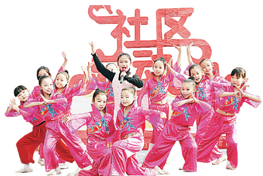
学校学生参加社区文艺活动