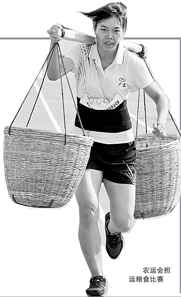
农运会担运粮食比赛