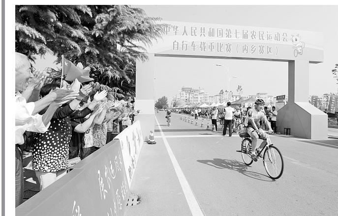
农运会自行车载重比赛