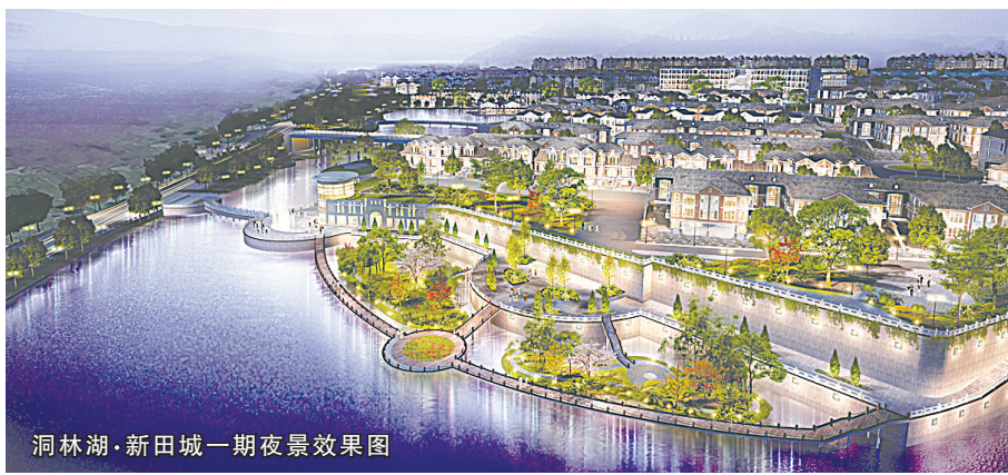
洞林湖·新田城一期夜景效果图

我们要在哪里陪着孩子一块长大?在哪里永葆孩子的童心、童稚、童贞?我们要在哪里永浴爱河,让年轻人的爱情永远保鲜永葆爱情之树常青?我们要在哪里找到一方天地,在午后的冬日暖阳下品茗?让疲惫的心情从此飞扬?我们要在哪里找到一张摇椅,细数一生的流年,享受最浪漫的黄昏?答曰:新田城,一座面向国际、面向未来的田园之城、生态之城、健康之城、度假之城、养老之城、教育之城、商业之城。这里的人们,不是“活着”,而是“生活”;不是负担,而是享受;不是喘息,而是吟唱;不是匍匐,而是跃动;不是隐忍,而是释放;不是急迫,而是悠游;不是琐屑,而是雍容。他们“活在风景中,永远是主角”。