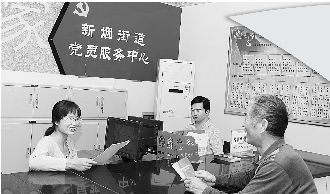
党员服务中心是广大党员温馨的家。