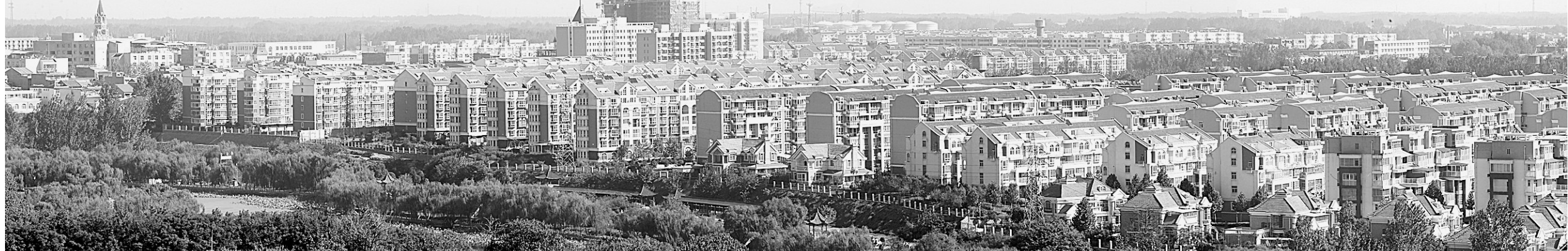
环境优美的滨河帝城小区。

“网格化管理是一种新型的社会管理模式，我们在边实践、边探索的过程中，不断总结更适合我们新烟街道的管理模式。总的来说，我们的理念就是更好地为群众服务，打造特色、专业的‘服务品牌’，最终目的是改善民生，使群众生活环境更好、生活品质更高！所谓‘大家好才是真的好’！”新烟街道办事处负责人如是告诉记者。