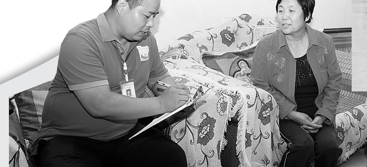
网格长正在入户走访、登记排查。

新烟街道用基层组织的先进性助推工作落实、用工作的成效检验基层组织的战斗力。按照领导包项目、包企业，机关干部下社区的要求，全体党员干部深入一线破解发展难题，先后完成了王辰年黄帝故里拜祖大典筹备任务；积极稳步推进城中村改造工作；加快背街小巷整治步伐，投资56.7万元对和庄社区道路进行升级改造，投资29.6万元对车站小学家属院、农机公司家属院进行综合整治，使辖区城市形象明显提升，人居环境进一步改善。