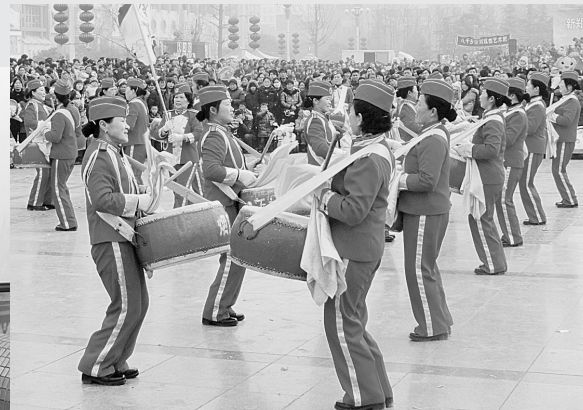
群众性文化活动丰富多彩。