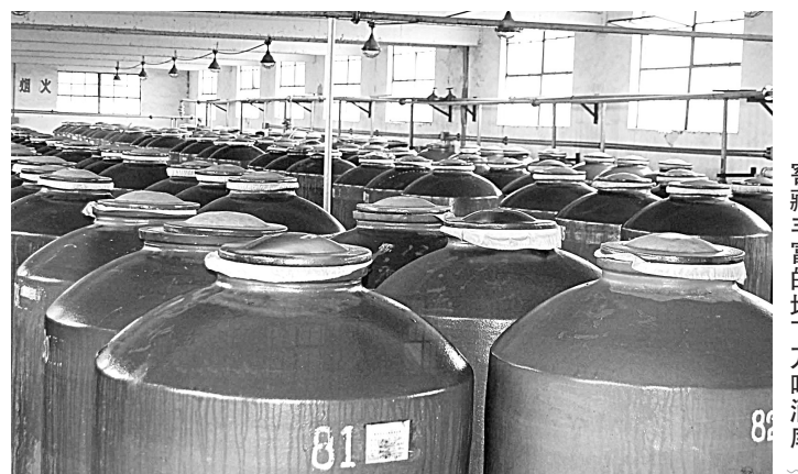
窖藏丰富的地下万吨酒库

情况下,中低档酒至少要封藏3~5年,像古井贡酒·年份原浆这样的高档酒都要足年份窖藏之后,才能交由国家级白酒大师精心进行酒体设计,品评合格后方可进入市场销售。 “善守者,藏于九地之下”。对人来说,藏,是一个不断内化、自我提升的过程。贾岛曾经写过一首诗“十年磨一剑,霜刃未曾试。今日把示君,谁有不平事?”此诗深谙“藏”之道。而对原酒来说,藏更有其妙不可言的功效。在窖藏的过程中,原酒精华慢慢凝定。精华原浆,纳日月之灵气,在恬静中休养舒展,封存老熟。经时光历练,原酒中原生质不断孕育,风味物质进一步缔和,酒体变得绵甜、醇厚、柔顺。闻名遐迩的“酒中牡丹”古井贡酒,便是在这里不断孕育,悄悄绽放。 屈媛媛