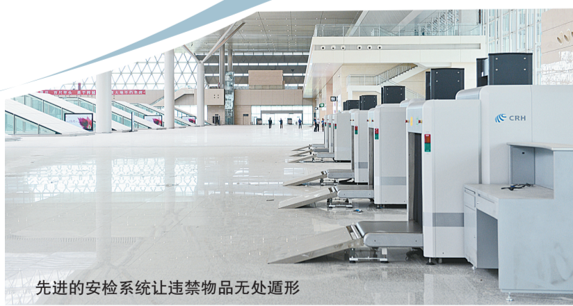
先进的安检系统让违禁物品无处遁形