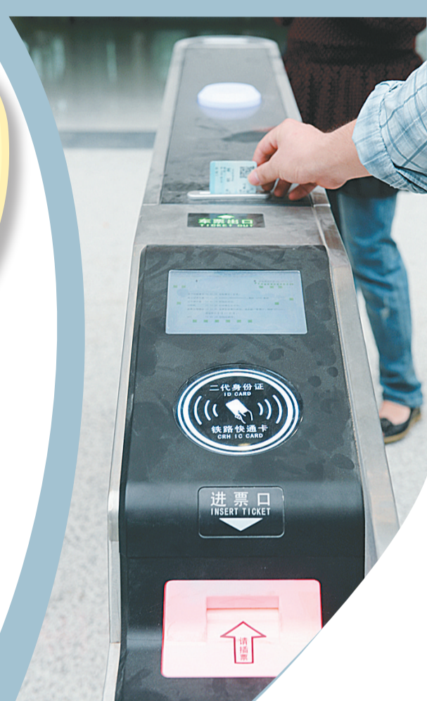
自动检票系统快速便捷