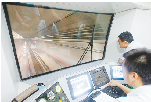
武汉地铁2号线列车首次金银潭至常青花园站区间进行通电试车。

武汉襟江带河，交通便利，被誉为“九省通衢”之地。在全国国土开发和建设布局的基本框架中，武汉处于沿江主轴线和京广二级轴线的结合部位，具有承东启西、沟通南北、维系四方的作用。