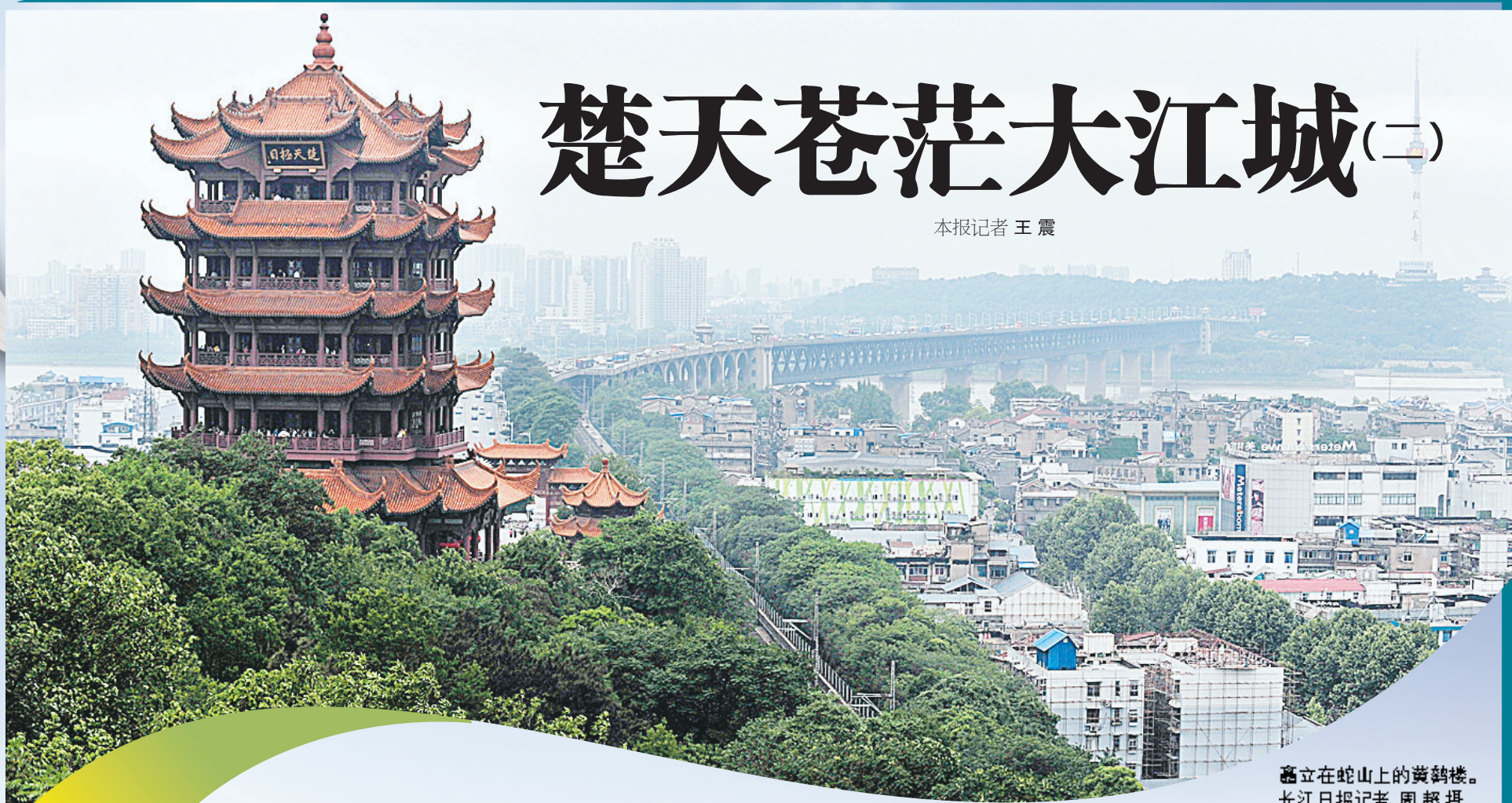
矗立在蛇山上的黄鹤楼。

全长约10公里，共10个站点，分别是宗关、太平洋、硚口路、崇仁路、利济北路、友谊路、江汉路、大智路、三阳路和黄浦路。