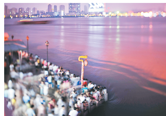
长江、汉江交汇处——龙王庙观景平台。

推荐酒店：武汉珞珈山国际酒店、武汉丰硕大酒店、武汉雄楚国际大酒店、武汉中天世纪大酒店