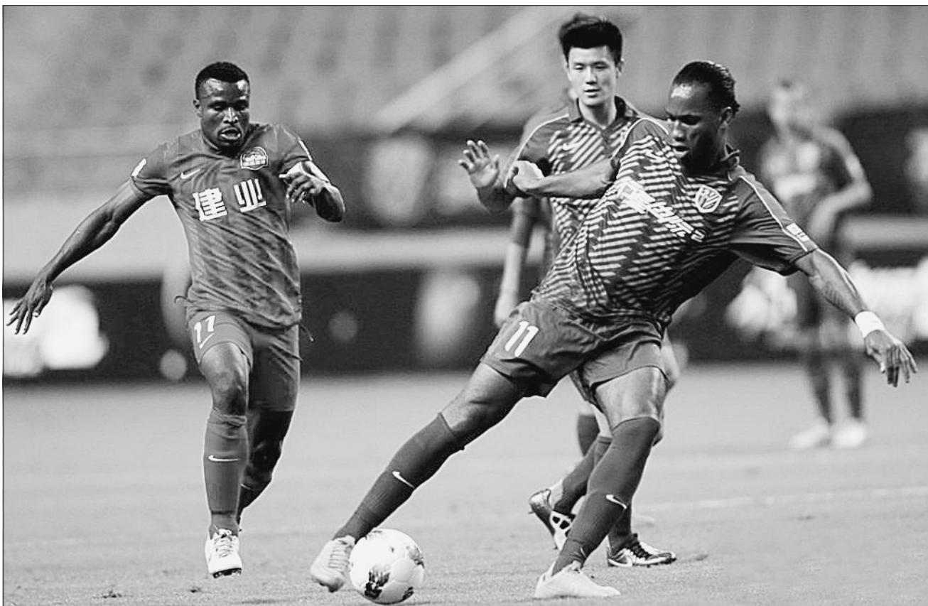
建业队11号(左)卡通戈与申花队11号德罗巴在拼抢。

据介绍,本次展览由华夏美术馆、省美协、省收藏家协会等联合主办,为确保将真正有艺术价值的作品展示给观众,华夏美术馆在前期筛选参展作者和展出作品时制定了严格详尽的标准:作者需具备顶尖的学院背景、成熟的创作技法,作品内容需雅俗共赏,具有较强的艺术感染力。