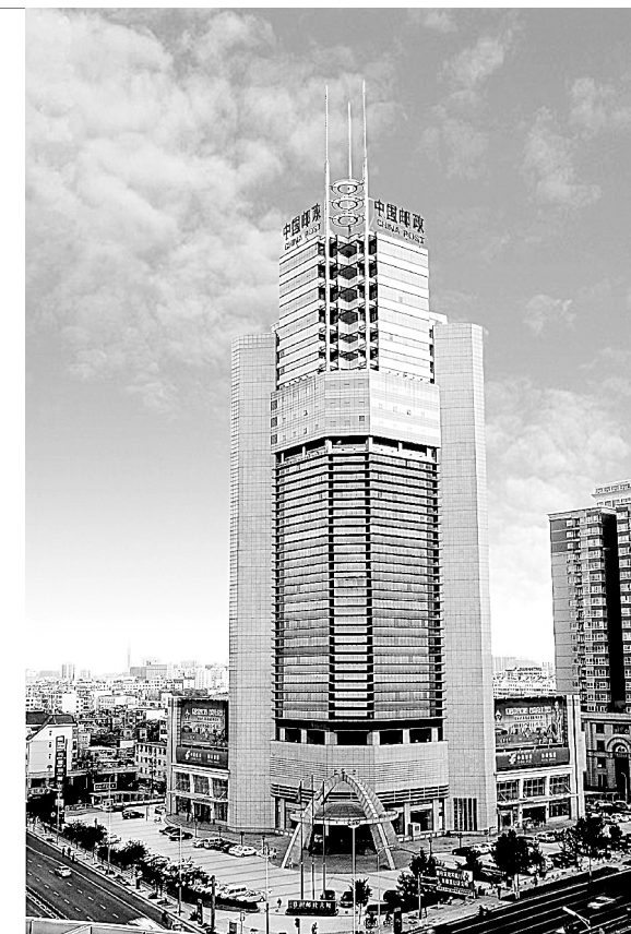
位于紫荆山路的郑州邮政大厦

“准”就是廉政风险等级评定“准”。一是内容评定准。二七区要求所有人员先自行评估,初步确定风险等级。然后分级分类、层层审核,确保等级评估内容的准确性。二是等级评定准。确定高风险、中等风险和低风险三种等级,为廉政风险贴上“标签”。三是综合评定准。建立风险等级评定信息库,要求各单位、各部门按时上报评定结果,并组织专门人员对全区每个岗位、每个部门、每个单位的评估结果进行逐一把关。