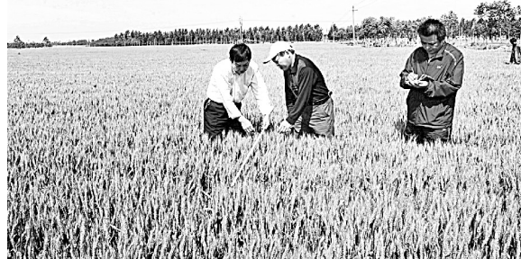
农艺师正在新郑市龙王乡邮政万亩小麦示范方产