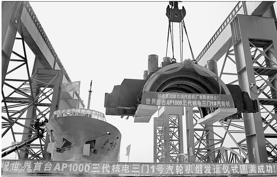
10月8日, AP1000三代125万千瓦等级核电汽轮机低压内缸在秦皇岛起运。

分析人士指出,本轮校园招聘将为恒大的快速发展提供强大的人才支撑,同时也再度提升了恒大的品牌雇主形象。可以预见,在新一批优秀学子加盟之后,恒大的核心竞争力将进一步增强,行业领军者地位将更加稳固。