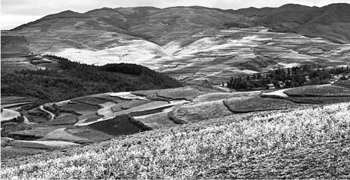
云南东川

赏苏州评弹 席前依稀船橹声,窗榻高悬灯笼红。三弦轻拨梧桐雨,莺喉婉唱钗头凤。无穷愁绪向句咽,有限痴魂守字情。苏州评弹不能听,一曲惹得泪纵横。