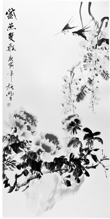
紫燕双飞(国画) 赵振刚

2007年4月8日,三军会师少林寺。第二天,我就看到了会操表演的多幅照片。我竟然看到了儿子,正在进行的军体拳表演中!凌厉的眼神,大幅度搏击的形体,大声嘶吼的口型。我仿佛闻见了儿子嘶声的怒吼。我都快认不出这是我的儿子了,那个一直在我印象中时尚而萎靡的儿子,那个喜怒哀乐形于色的儿子,那个温和得发冷的儿子。儿子这次用极其男性的方式让我们看到了一个全新的徐修远!晏繁长久地看着这幅照片,泪水数次滴进电脑键盘,嘿我赶紧下载保存,唯恐它立刻消失。随后,她将此照放大10寸保存。