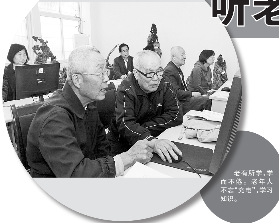
老有所学，学而不倦。老年人不忘“充电”，学习知识。

“老吾老，以及人之老”这一在中国广泛流传的名句，时时激励着人们友爱互助、共同促进社会和谐进步。尊老、敬老、爱老、助老已成为全社会的责任。发白如雪，弯躯似弓，睛若黄珠……当岁月的年轮深深镌刻在老人的脸上，我们蓦然地发现，有着精彩过去的老年人也拥有着幸福的晚年。