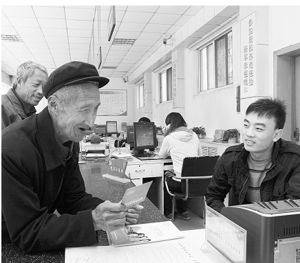
参加居民养老保险，新郑市60岁以上老人参保率达100%。

九九重阳，关爱久久。黄帝故里，用爱前行。他们十几年如一日，竭尽孝道，用爱心温暖亲人，让敬老爱亲成为不灭的长明灯，弹奏出一曲动人的尊老敬老之歌，使家庭和谐美满，使社会的稳定发展有了坚实保障。他们用点点滴滴的爱，在平凡的岁月中诠释着尊老爱老的中华美德；他们的事迹，传遍大街小巷，感动着每一个人，成为人们尊老敬老的典范和榜样。