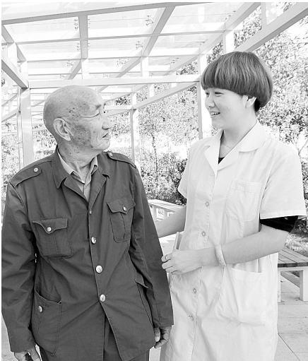
目前，新郑市越来越多的社会各界志愿者走进老年人的世界，关心老年人的生活。