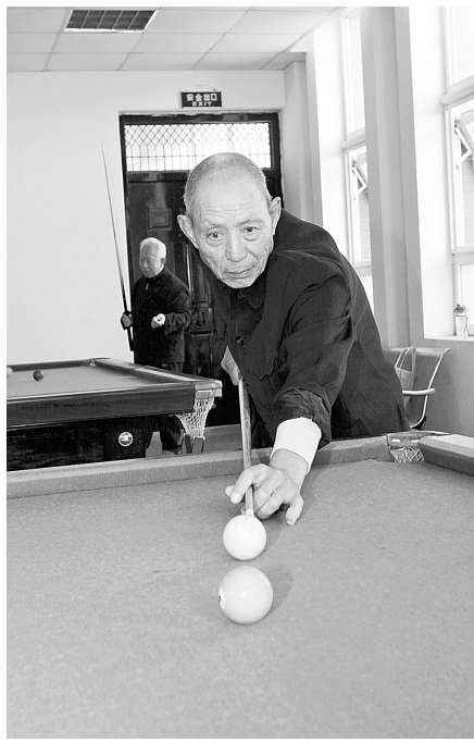
老有所乐，乐此不疲。老年人热衷娱乐活动，丰富自己的精神文化生活。