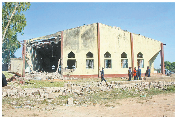
这是10月28日在尼日利亚北部卡杜纳州拍摄的发生袭击事件的教堂。

据新华社阿布贾10月28日电 尼日利亚北部卡杜纳州一座教堂28日早晨发生一起自杀式汽车炸弹袭击事件,造成至少8人死亡,100多人受伤。