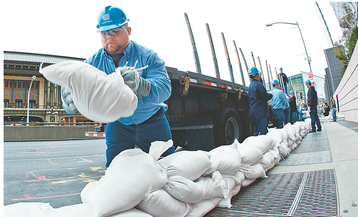
10月28日,在美国纽约,工作人员搬运沙袋,备战飓风“桑迪”。