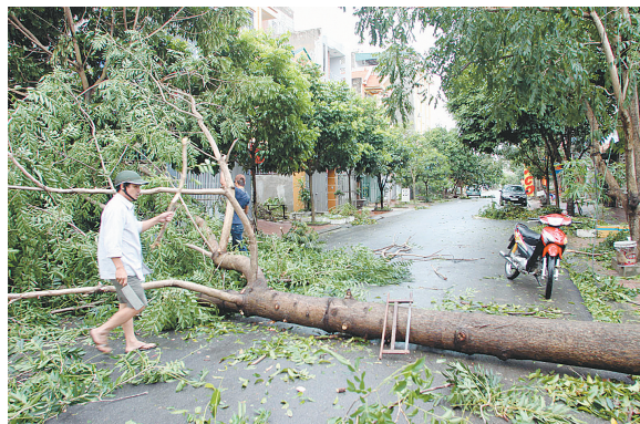
10月29日,在越南北部宁平省省会宁平市,当地居民在清理被台风刮倒的树木。