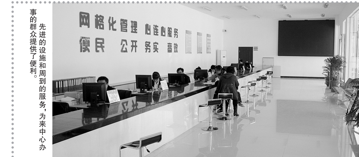
先进的设施和周到的服务,为来中心办事的群众提供了便利。

数据显示,青年路街道共投资2000多万元硬化道路27.4公里,亮化道路38条,铺设排水管网27.5公里,绿化2.5万平方米,为经济发展营造了良好环境。截至今年6月底,办事处地方公共财政预算收入完成5408万元,同比增长22.66%。在经济发展的同时,青年路街道每年投入3000余万元资金到各个民生领域,积极做好各项社会事业,在城镇低保、新农合、新农保、老年人生活补助、教育扶助、农民素质教育等方面均走在了全县前列。