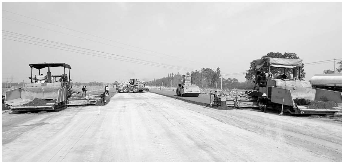
荥阳荥广路道路建设正在如火如荼地进行。

如何让群众既能住进新型社区又能致富?荥阳市以产城融合为支撑,规划实施了河南荥阳产业集聚区、郑州市新材料产业集聚区、郑州市五龙产业集聚区。在距离城区和产业集聚区相对较远的高村乡、王村