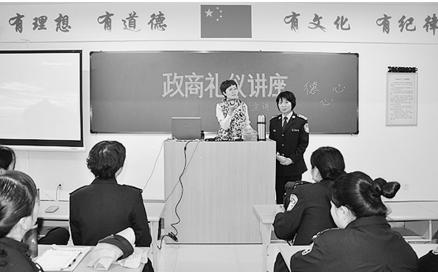
昨日,为提升干部职工的道德素质和文明程度,郑州市石佛劳教所邀请著名礼仪导师为干部职工进行“政商礼仪讲座”。