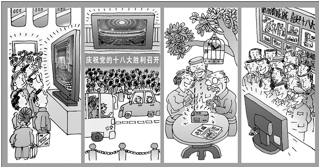
聚焦盛会 耳目一新