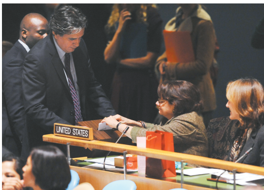
11月12日,在纽约联合国总部,美国代表在选举中投票,美国最终在选举中当选联合国人权理事会新成员。

联合国人权理事会于2006年成立,总部设在日内瓦。理事会共设47个席位,其中亚洲和非洲各占13席,拉美及加勒比地区占8席,东欧占6席,西欧和其他地区占7席。理事会成员任期为三年,在连续两任后没有资格立即再次当选。联大每年改选三分之一左右的理事会成员。