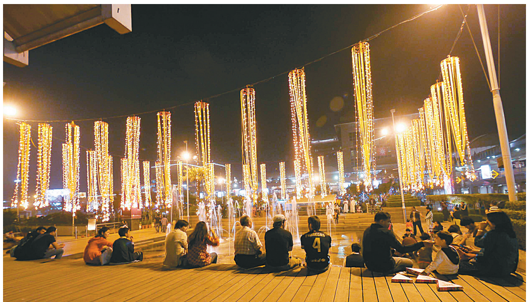
11月12日,在印度首都新德里市南部商业区的一个购物中心前,人们坐在灯饰前休息。在印度最大的节日之一——排灯节前夕,印度的许多商业区、街道和居民住宅都被灯饰和彩带装饰得艳丽多彩。