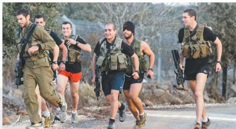
11月12日,以色列士兵在靠近以色列-叙利亚边界军事缓冲区的戈兰高地上训练。

以色列总理内塔尼亚胡12日表示,以色列不会容忍任何侵犯以色列边境或向以色列公民开火的行为。他说,以色列正密切监测以叙边境形势,并将对任何侵犯行为进行反击。