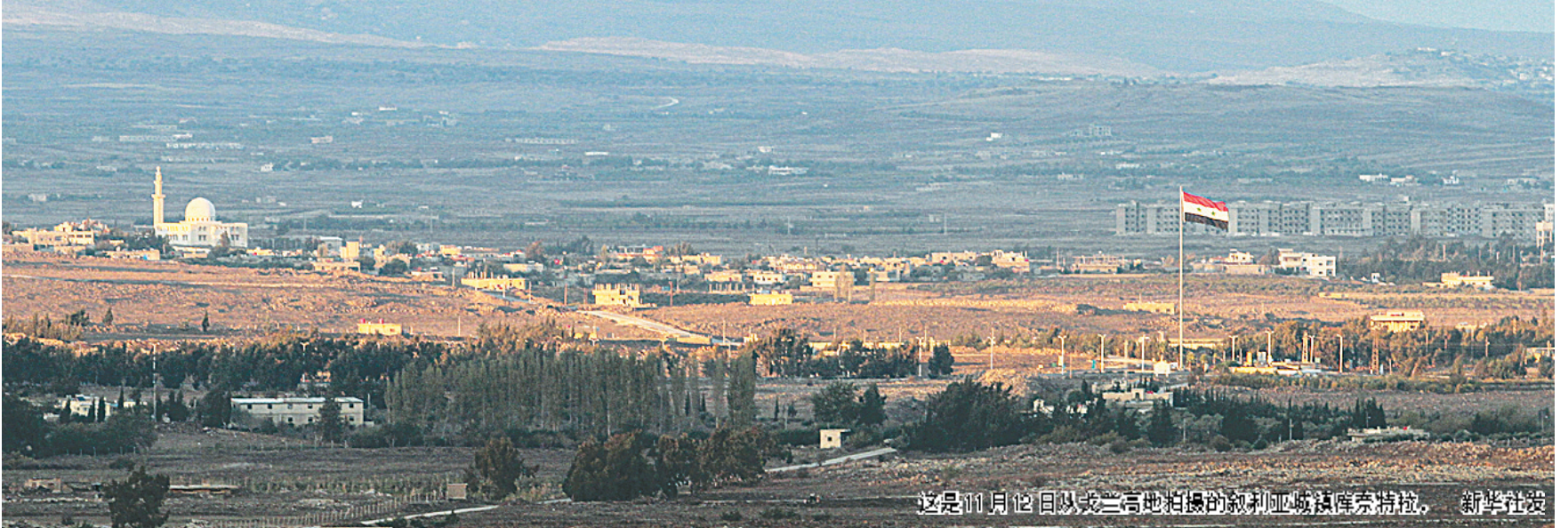
这是11月12日从戈兰高地拍摄的叙利亚城镇景象。