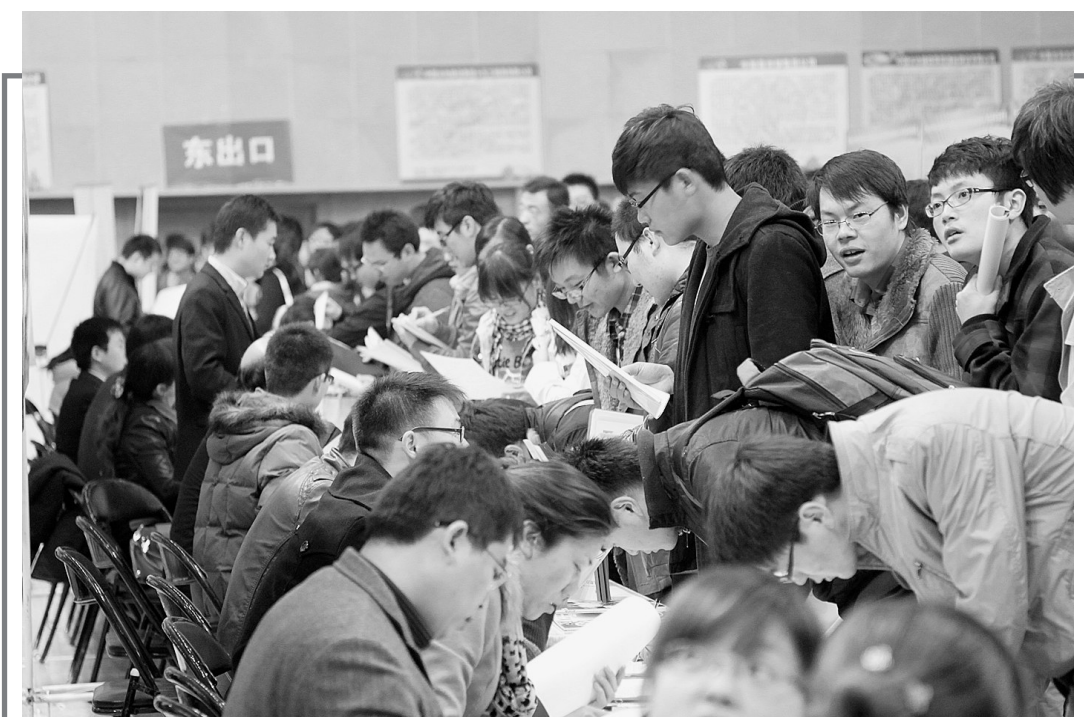
11月17日上午,在华北水利水电学院举行的全省首场水利水电类就业双选会上,来自全国各地的1万多名毕业生参加了招聘会,100多家用人单位提供2500个就业岗位。

《汽车之友》杂志主编高华指出:“目前提到后市场,更多人想到贴膜、大包围、汽车座垫、脚垫、轮胎改装或者是音响改装等,作为一个完整的汽车后市场组成部分,涉及汽车改装领域的还有老爷车的收藏、修复,这是一个更加能够让人感到震惊的市场规模。”他呼吁政府制定出一个更具前瞻性、开放性的鼓励体系。