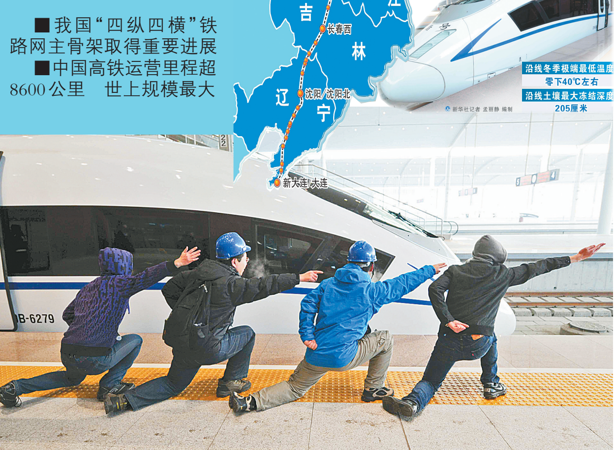
12月1日，哈尔滨西站，几名乘客在动车车头旁的站台上摆出“航母STYLE”造型。

据新华社哈尔滨12月1日电(记者齐中熙 邹大鹏 徐扬)1日9时整，四列CRH380B型高寒动车组分别从哈尔滨西站、长春站、沈阳北站、大连北站四站同时首发，中国首条、同时也是世界上第一条投入运营的新建高寒地区长大高速铁路——哈大高铁开通运营。 “哈大高铁通车，标志着中国以‘四纵四横’为主骨架的快速铁路网建设取得重要进展。哈大高铁可以通过既有的秦沈客运专线和京秦铁路，实现同已经运营的京沪高铁和即将全线