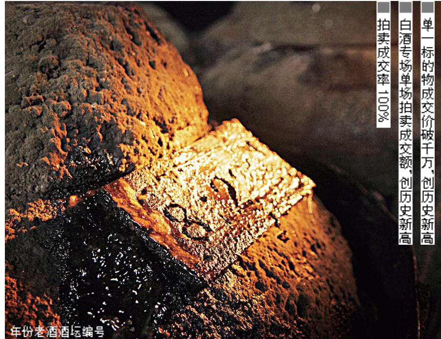
单一标的物成交价破千万,创历史新高 白酒专场单场拍卖成交额,创历史新高 拍卖成交率100%

据了解,泸州老窖特曲老酒一上市就受到市场的热捧,它一定能够引领泸州老窖品牌,创造新的荣耀。