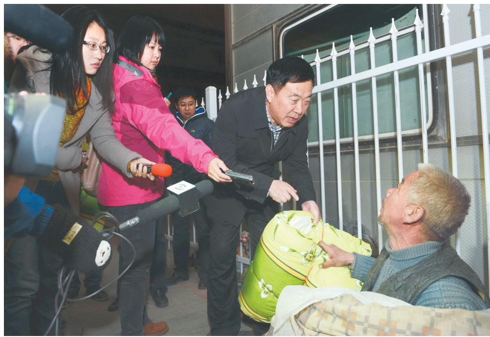
工作人员在嵩山路南三环立交桥下救助露宿者。本报记者 唐强 摄

(办)以及民政、公安、卫生、安检等多个部门共组织500多人,分头行动,展开救助大行动。