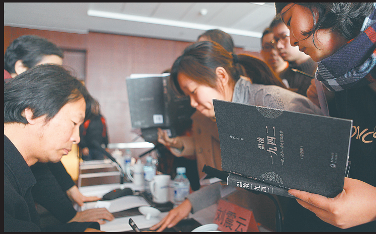
刘震云为读者签名

早在20年前,刘震云的调查体小说《温故一九四二》就以走访实录和史料整理的形式,首次将1942年河南饥荒以文学形式呈现出来。上世纪90年代初,王朔把这本书推荐给冯小刚,冯小刚读后“对本民族的认识产生了飞跃”,决定把小说改成电影。然而从小说出版到电影上映,竟走过了19年时间。