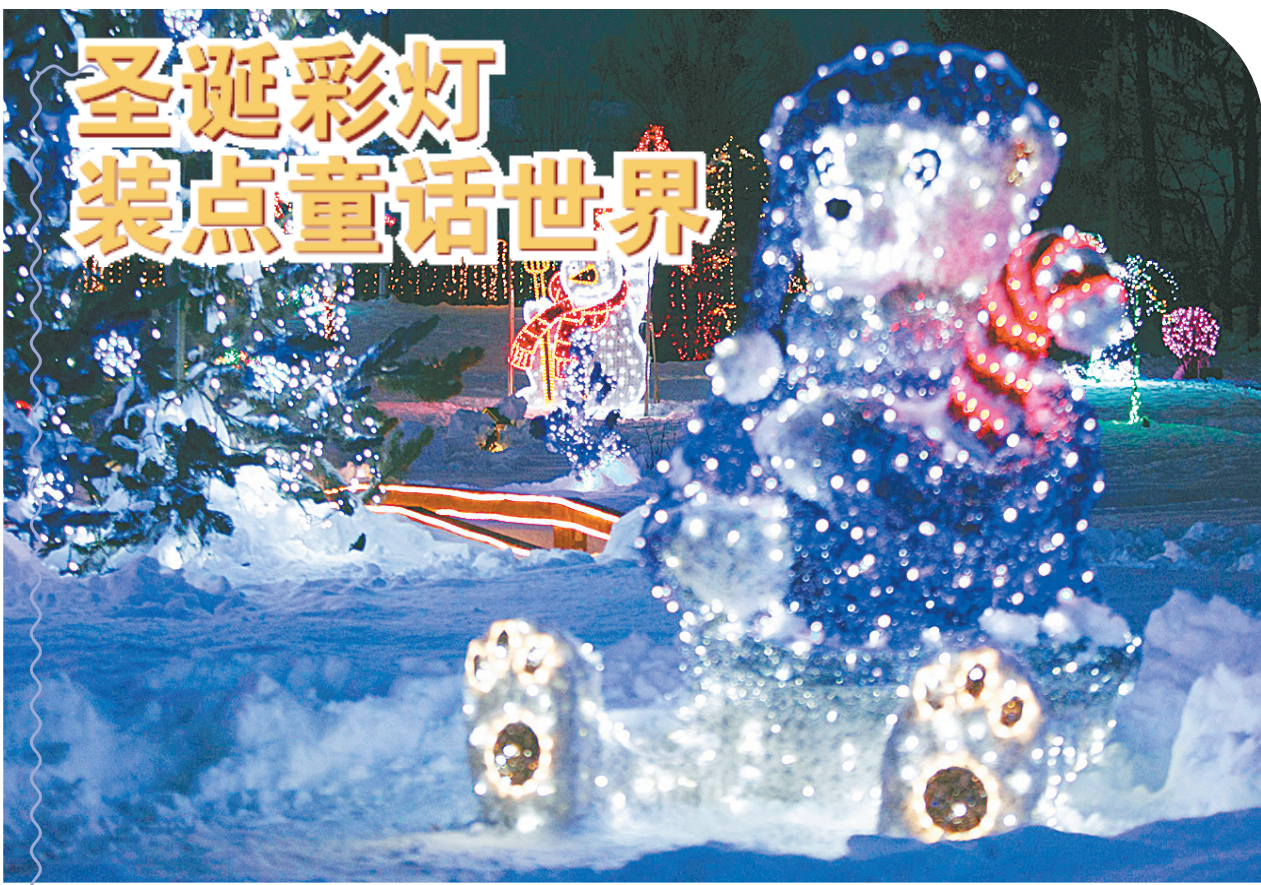
12月12日,在距克罗地亚首都萨格勒布70公里的戈拉波夫尼察村,雪人与小熊造型的彩灯遥相呼应。 日前,克罗地亚69岁的退休工程师沙拉伊用约130万只彩灯将他位于戈拉波夫尼察村的农庄装扮成圣诞公园。公园自12月初开放以来,吸引了上千名游客。

洪磊说,朝鲜半岛形势时起时伏,根源是安全关切问题。朝鲜射星问题进一步凸显了重启六方会谈的重要性和紧迫性。我们希望有关各方共同为重启和推进有关进程作出努力。