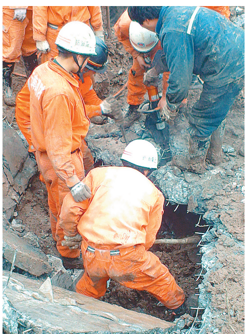
1月11日,消防人员在山体滑坡事故现场救援。

新华社昆明1月11日电 1月11日8点20分左右,镇雄县果珠乡高坡村赵家沟村民小组发生山体滑坡,其中被埋居民14户46人。记者从云南省昭通市镇雄县委宣传部获悉,截至11日20时30分,云南镇雄县果珠乡高坡村赵家沟村民小组山体滑坡已造成42人遇难,2名伤员已经脱离生命危险。