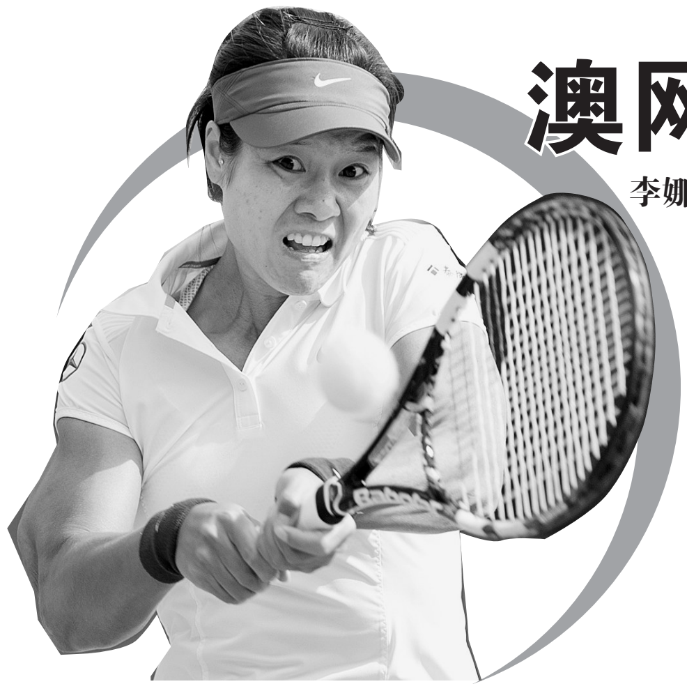
李娜在比赛中回球。

新华社墨尔本1月14日专电 2013年澳大利亚网球公开赛14日拉开正赛帷幕。中国“一姐”李娜以6:1、6:3速胜哈萨克斯坦的卡拉坦切娃,顺利晋级第二轮。在一场“中国内战”中,“金花”郑洁以6:1、3:6和6:4险胜持外卡参赛的“小花”张宇璇,晋级第二轮。