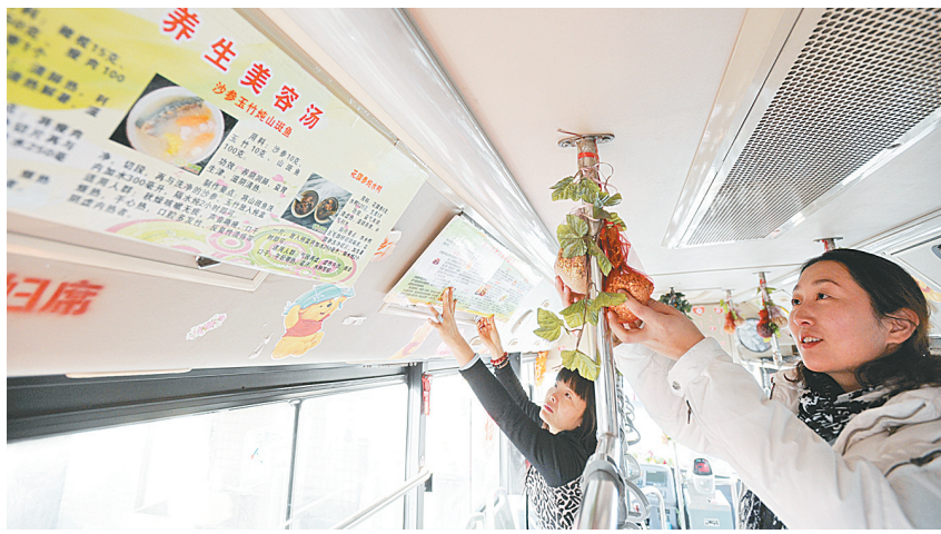
昨日,公交二公司推出“美容养颜”车厢,62路车长用工艺花等对车厢进行精心布置,并在精美的展板上,为乘客提供了内容丰富的美容养颜“秘籍”。