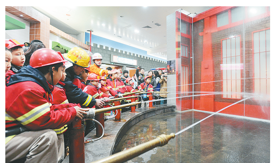
昨日,市消防支队的消防官兵来到大未来儿童游乐场,通过儿童消防设施为孩子们讲述消防小常识。