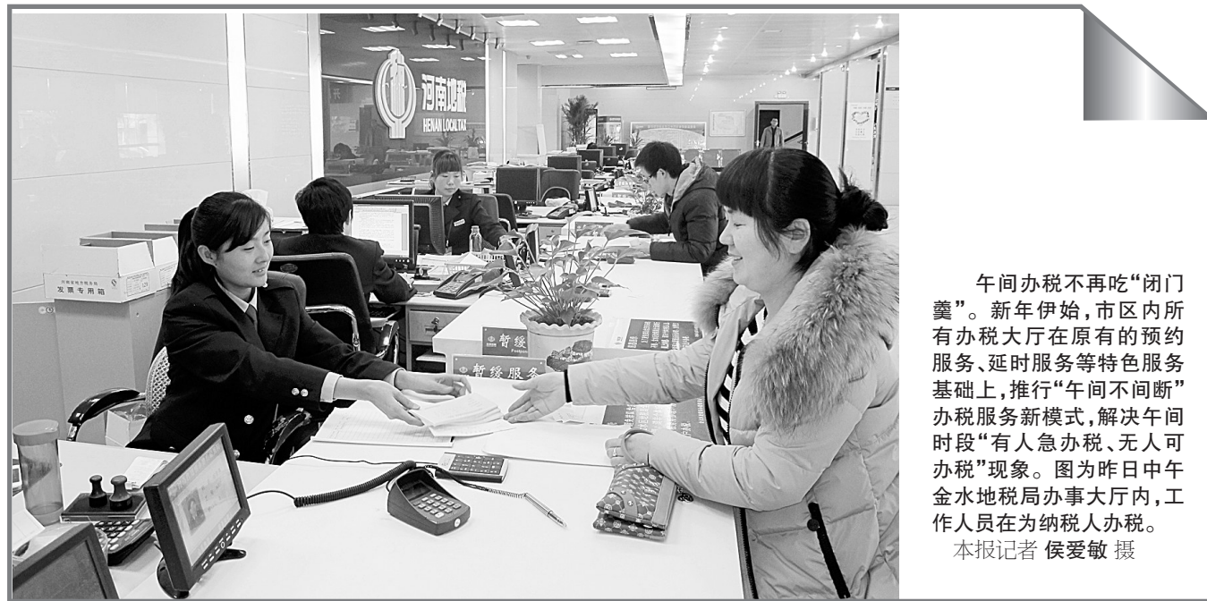
午间办税不再吃“闭门羹”。新年伊始,市区内所有办税大厅在原有的预约服务、延时服务等特色服务基础上,推行“午间不间断”办税服务新模式,解决午间时段“有人急办税、无人可办税”现象。图为昨日中午金水地税局办税大厅内,工作人员在为纳税人办税。

本报讯(记者 侯爱敏 通讯员 朱青峰)记者从郑州市地税局发票管理局获悉,即日起我市企业在领取地税部门的发票时,无需再缴纳任何费用。今年起地税部门全面取消发票工本费。 这是继去年免征小型微型企业发票工本费后,地税部门又一重大惠民举措,将切实减轻企业和社会负担。据介绍,2012年市地税局取消了小型微型企业的发票工本费,此举一年来共为全市小微企业节省开支600多万元。今年,发票工本费全面取消,据初步统计,对于发票使用量较大的企业,每年将节省开支数十万元。 据该局有关负责人昨日介绍,2012年全市纳税人共缴纳地税发票工本费3075万元,今年起,这项费用将由财政统一负担。