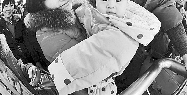
一月二十四日,孩子们跟随着他们的父母开始了返乡之路(拼版照片)。