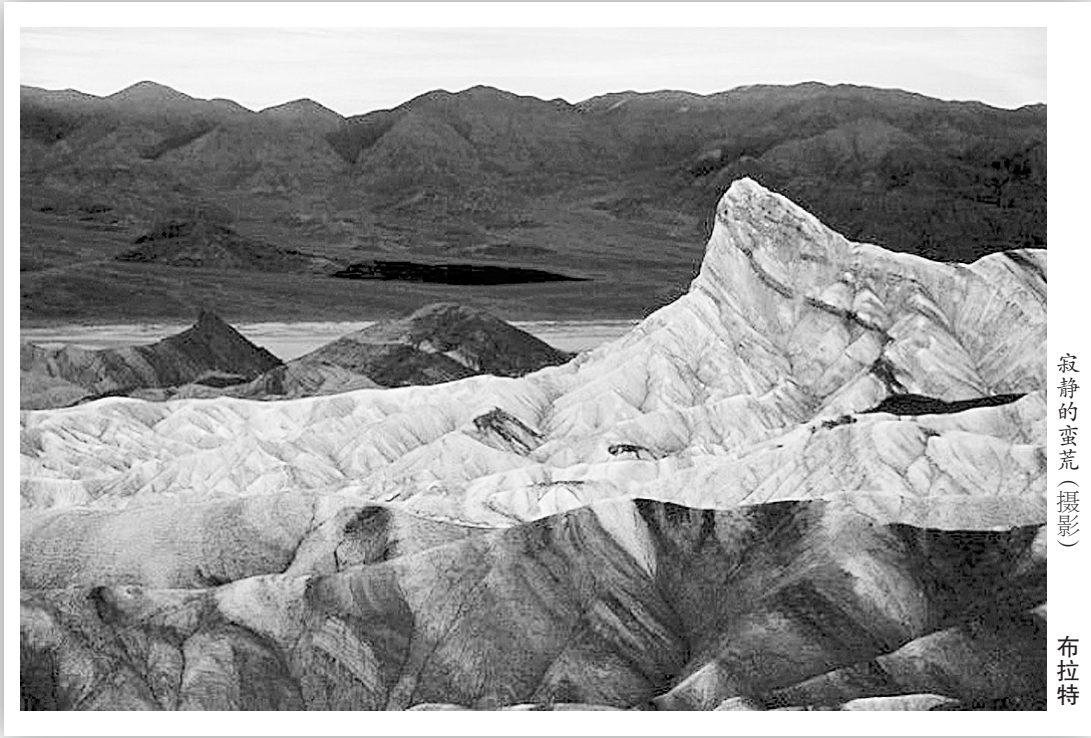
寂静的荒芜(摄影) 布拉特

作品中还对一些主人公人生中的悲欢离合、爱恨情仇进行了描写，不仅丰富了作品的内涵，具有对于人性的永恒表达。 作者把自己的精神世界与艺术创作融为一体，经历几多精神交锋、情感挣扎甚或无数次痛苦的磨炼，使蕴藏在她自身的理性思考得以熊熊燃烧。