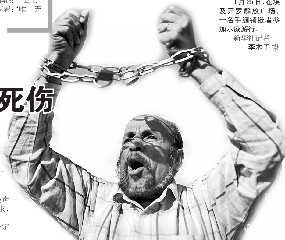
1月25日,在埃及开罗解放广场,一名手铐锁链者参加示威游行。