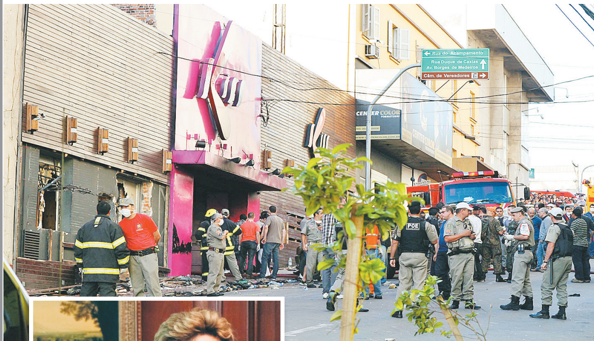
↑1月27日,在巴西南部城市圣玛丽亚,救援人员在发生火灾的夜总会门口工作。