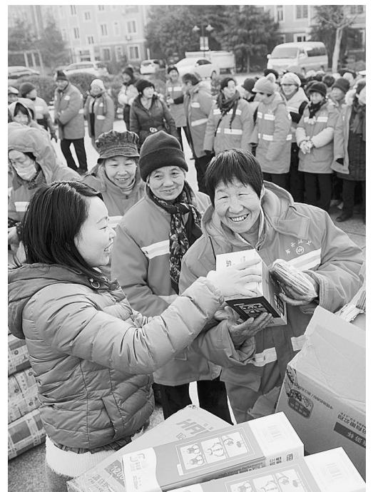
昨日,东风路街道办事处联合辖区内爱心企业一起为辖区环卫工人送去暖身贴和“爱心水杯”。

培训结束后将对所有参训人员进行考试合格后方可申办烟花爆竹经营(零售)许可证,有效提高烟花爆竹经营从业人员的安全意识,确保烟花爆竹经营安全。