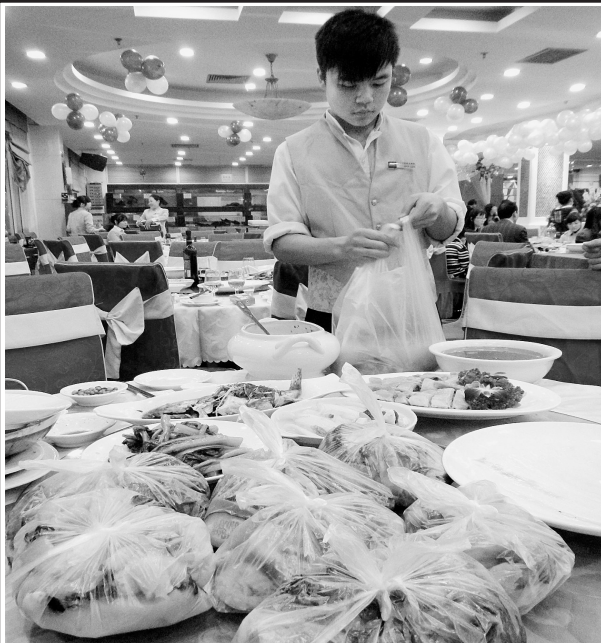
婚宴结束后,饭店员工打包未吃完的食物。