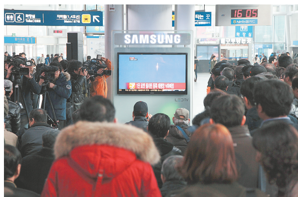
1月30日,在韩国首尔,韩国民众通过电视观看“罗老”号运载火箭发射升空。