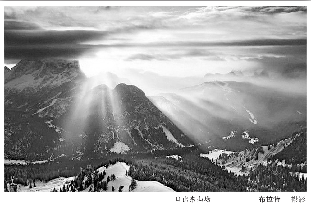
日出东山坳