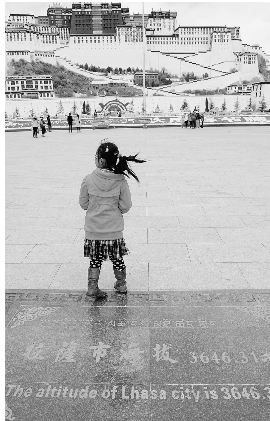
拉萨布达拉宫广场地面上刻着拉萨的准确海拔高度——3646.31米(2月13日摄)。

“日光城”拉萨已经成为最受国内外游客青睐的旅游目的地之一。但是，一些游客却不知道拉萨的具体海拔高度。日前，有关方面公布权威数据，并且用藏、汉、英三种文字在布达拉宫广场上刻下拉萨的海拔高度——3646.31米。