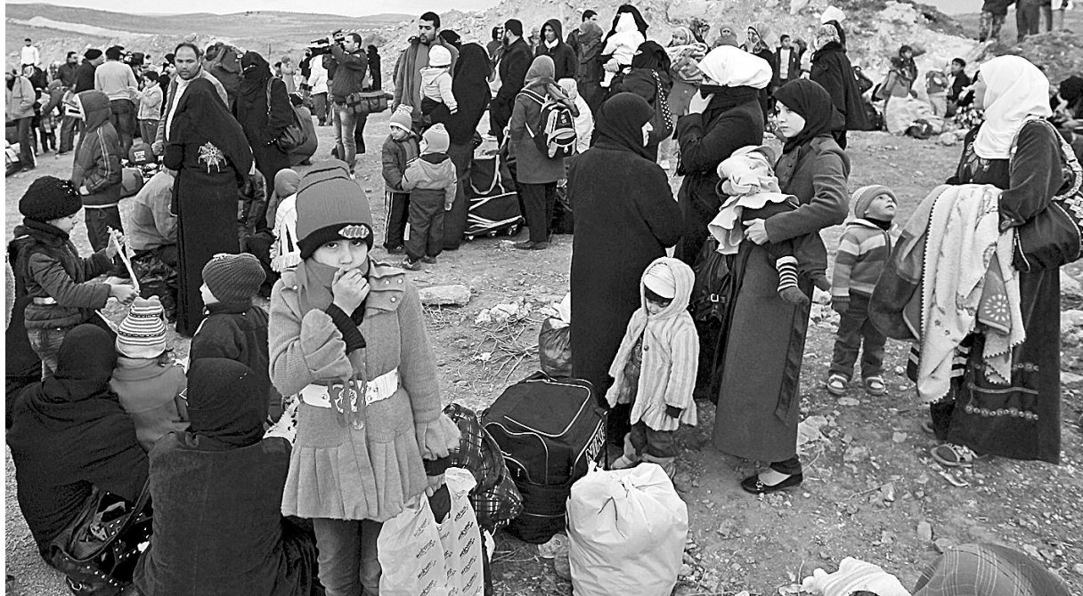
2月18日,叙利亚难民抵达约旦北部的马弗拉克省。据约旦军方统计,2013年以来约有8.9万叙利亚难民涌入约旦境内。