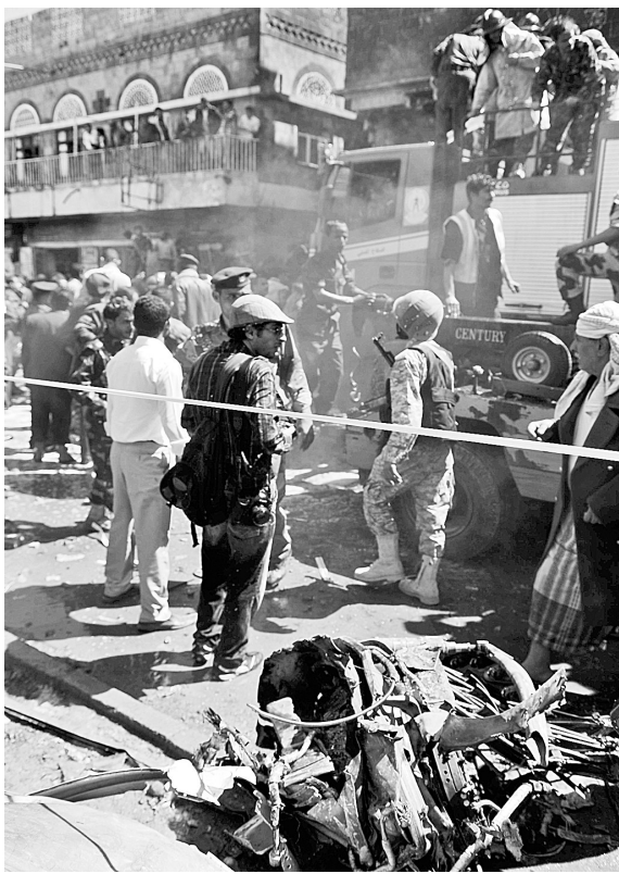
2月19日,在也门首都萨那,警察封锁坠机现场。也门安全官员称,一架军用飞机当日在首都萨那市中心坠毁,造成至少9人死亡,23人受伤。