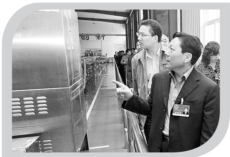
人大代表视察重点企业发展情况,为经济发展建言献策。