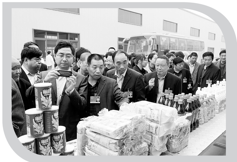
新郑市人大常委会服务发展大局,围绕经济发展和民生改善,主动选题,先后对招商引资、社区建设等工作进行专题调研。