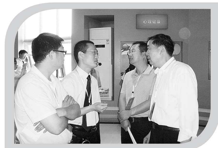
人大代表积极主动参与社会管理服务,最大限度地发挥代表在社会管理中的作用。图为新郑市人大代表在青少年及大学生服务中心视察。