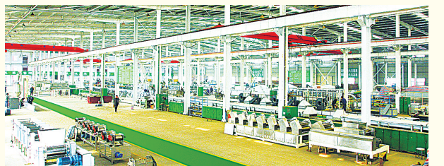
东方集团生产流水线