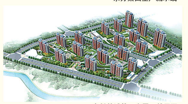
合村并城第一安置区效果图