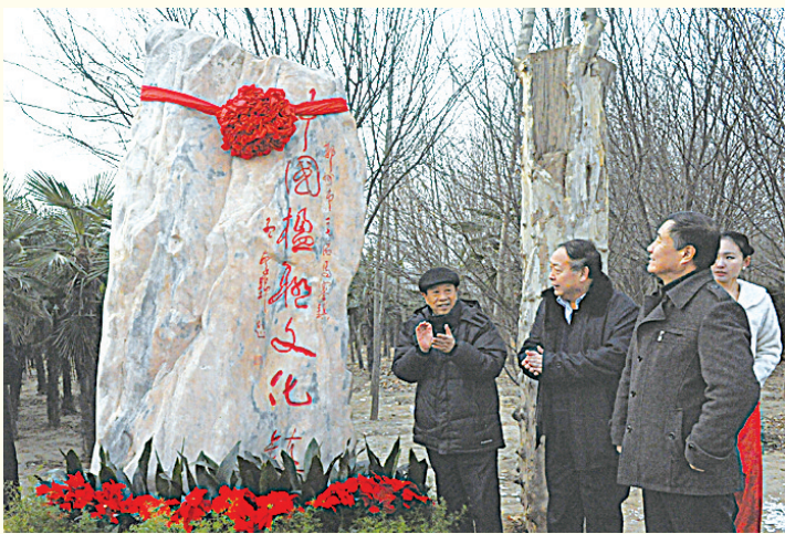
马寨镇荣获“中国楹联文化镇”称号

深入贯彻落实科学发展观,紧紧围绕新型城镇化建设、现代产业发展和“坚持依靠群众,推进工作落实”等三大主题工作,马寨镇以加快转变经济发展方式、创新社会管理为主线,按照新型工业化、“四集一转”和“三年倍增,五年超越”的要求,全力保障经济运行,推进重大项目建设,增强招商引资实效,加快基础设施建设,完善集聚区功能,破解发展瓶颈,打造服务品牌,经济社会实现平稳较快发展,产城一体化程度大幅提升,各项工作取得不俗成绩。