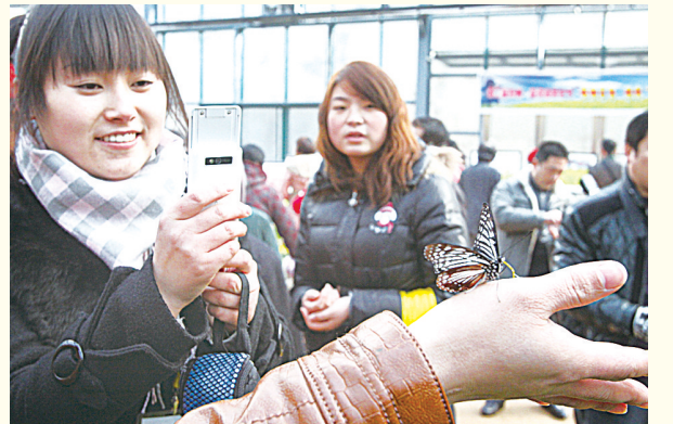
市民拍摄蝴蝶岛美景

马寨管委会主任、马寨镇党委书记赵国玺表示,2013年,马寨镇将以晋级“城市新区”为总目标,在二七区委、区政府的正确领导下,在区委书记蔡红、区长王鹏的带领下,以加快镇区经济建设为主线,继续深化“坚持依靠群众,推动工作落实”长效机制、新型城镇化建设等工作,继续坚定不移地走产业集聚、品牌带动、城镇一体化之路,大力提升经济承载力及发展活力,提升城镇形象品位,提升居民幸福指数,全面推动经济和社会各项事业跨越式发展,努力把马寨打造成郑州西南“产城一体”的现代化城镇。