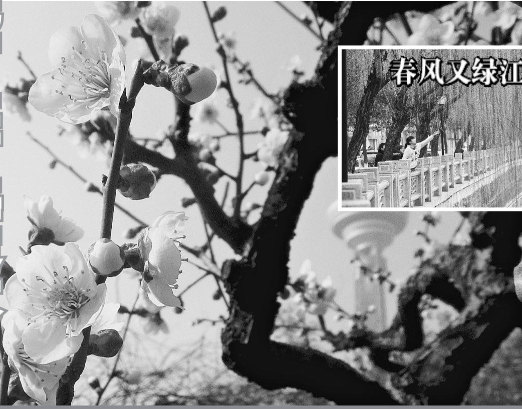
南京古林公园中梅花盛开(2月24日摄)。