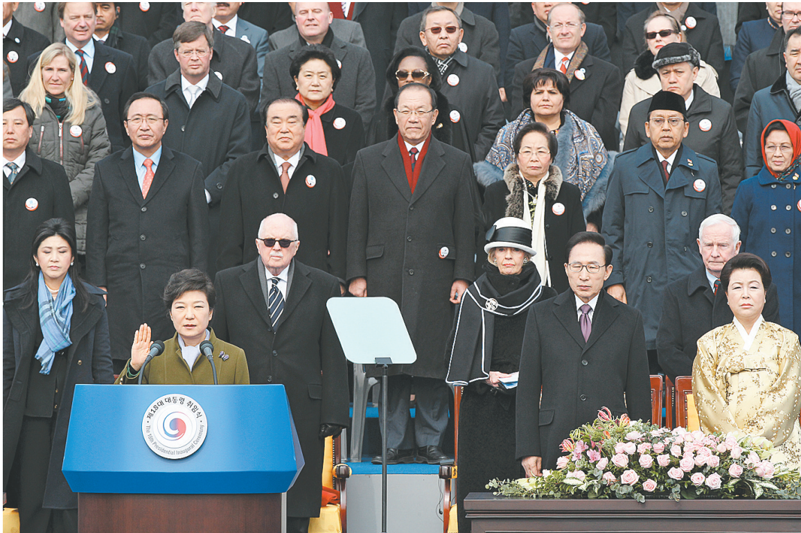
2月25日,在韩国首尔,韩国当选总统朴槿惠宣誓就职。

朴槿惠敦促朝鲜立即放弃核野心,不要再浪费资源开发武器。“我敦促朝鲜毫不迟疑地放弃核野心,走上和平、共同发展的道路。” 朴槿惠说:“朝鲜最近的核试验是对朝鲜半岛民众生存和未来的挑战,毫无疑问,朝鲜自身将是最大受害者。” 朴槿惠25日还在讲话中说:“为缓解紧张和冲突,进一步在亚洲推广和平与合作,我将致力于增加与美国、中国、日本、俄罗斯和其他亚太国家间的信任。” 新华社特稿