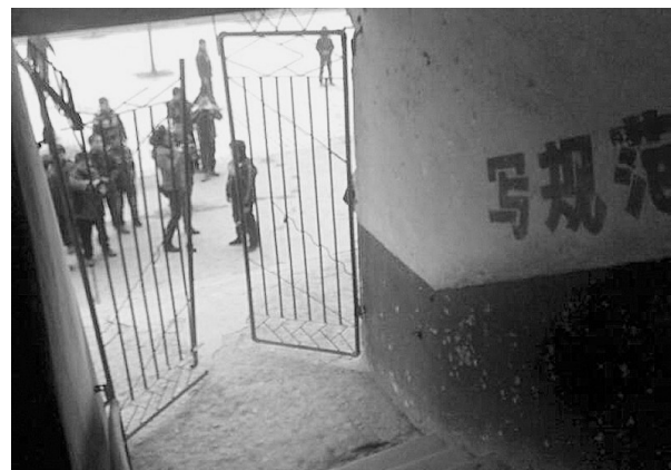
2月27日在薛集镇秦集小学拍摄的发生踩踏事故的楼梯口(手机照片)。

据新华社武汉2月27日电(记者 袁志国 徐海波)27日早晨,湖北省老河口市秦集小学发生一起因拥挤引起的踩踏事件,导致11名学生受伤,4名学生因抢救无效死亡。下午6时许,老河口市召开新闻发布会宣布,初步认定该事件为责任事故,8名干部被免职撤职,4人移送司法机关依法处理。