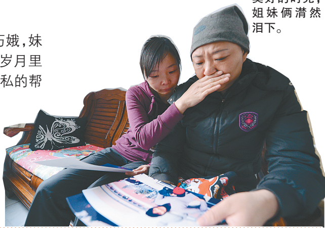
看着老照片，回忆过去美好的时光，姐妹俩潸然泪下。