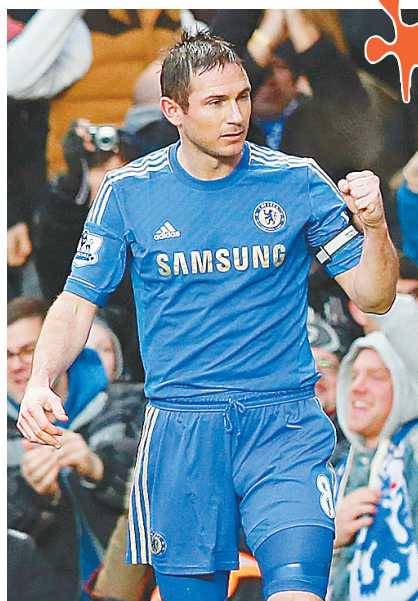
3月17日,切尔西队球员兰帕德在比赛中庆祝进球,这也是他为切尔西打进的第200粒进球。当日,在英超联赛第30轮比赛中,切尔西队主场以2:0战胜西汉姆联队。作为一名后腰队员,“灯神”兰帕德做到了许多前锋都无法做到的事情。 新华社发

当日,NBA常规赛中迈阿密热火队客场以108:91击败多伦多猛龙队,取得22连胜。22场连胜追平了NBA历史上的第二长连胜纪录,现在热火队面前,只剩下当年湖人创造的33连胜纪录了。 新华社发