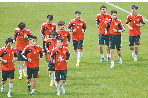
左图:传闻中,如果这一场再拿下伊拉克队,卡马乔可能会被解雇,这会是他中国国家队任上的最后一场比赛吗?