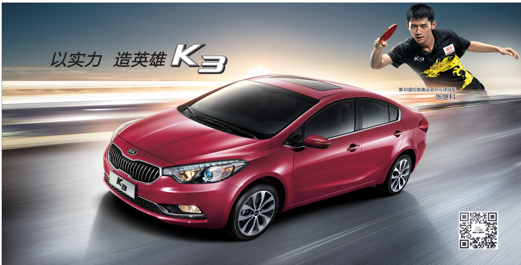
第30届伦敦奥运会乒乓球冠军 张继科

无数次的挥拍,成就一个傲世的英雄;无数实力的累积,才能造就一辆不凡的座驾——K3!以“未来”为设计理念:LED日间行车灯、10向电动座椅、车身动态稳定控制系统,多项人性化配置全面彰显K3做人实力,你我共同见证!