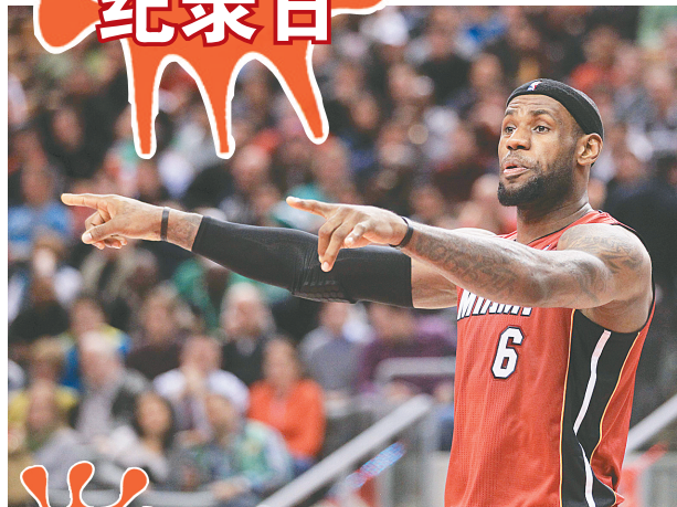
3月17日,热火队球员勒布朗·詹姆斯在比赛中指挥队友。

当日,NBA常规赛中迈阿密热火队客场以108:91击败多伦多猛龙队,取得22连胜。22场连胜追平了NBA历史上的第二长连胜纪录,现在热火队面前,只剩下当年湖人创造的33连胜纪录了。